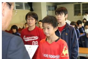
【1年生の学級役員の皆さん】