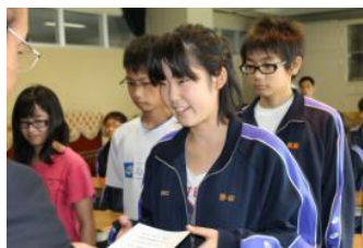
【認証状を受け取る新会長】

前期の執行委員会のみなさん、大変おつかれさまでした。後期は後輩への援助やお手伝いをお願いします。