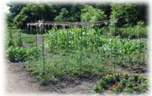
順調に生育を続ける学級菜園の作物