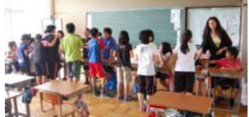
【5年生の国際科の授業風景】

ださり、子どもたちにとって、とても楽しい学習の一つとなっていました。アメリカに帰ったあとは、お体に気をつけて活躍してほしいと思います。三笠のことはいつまでも忘れないでいて下さい。2年間、本当にありがとうございました。