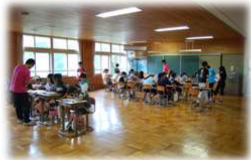
算数バリバリコースとじっくりコース

結びになりますが、休み中は学校ではできない貴重な体験がいっぱいできると思います。夏休みの計画に基づき、自分を磨いてください。特に、水の事故や交通事故にあわないように常に安全に心がけましょう。休み中、中央公園など盆踊り大会で校長先生を見かけたら声をかけてください。2学期の再会を楽しみにしています。