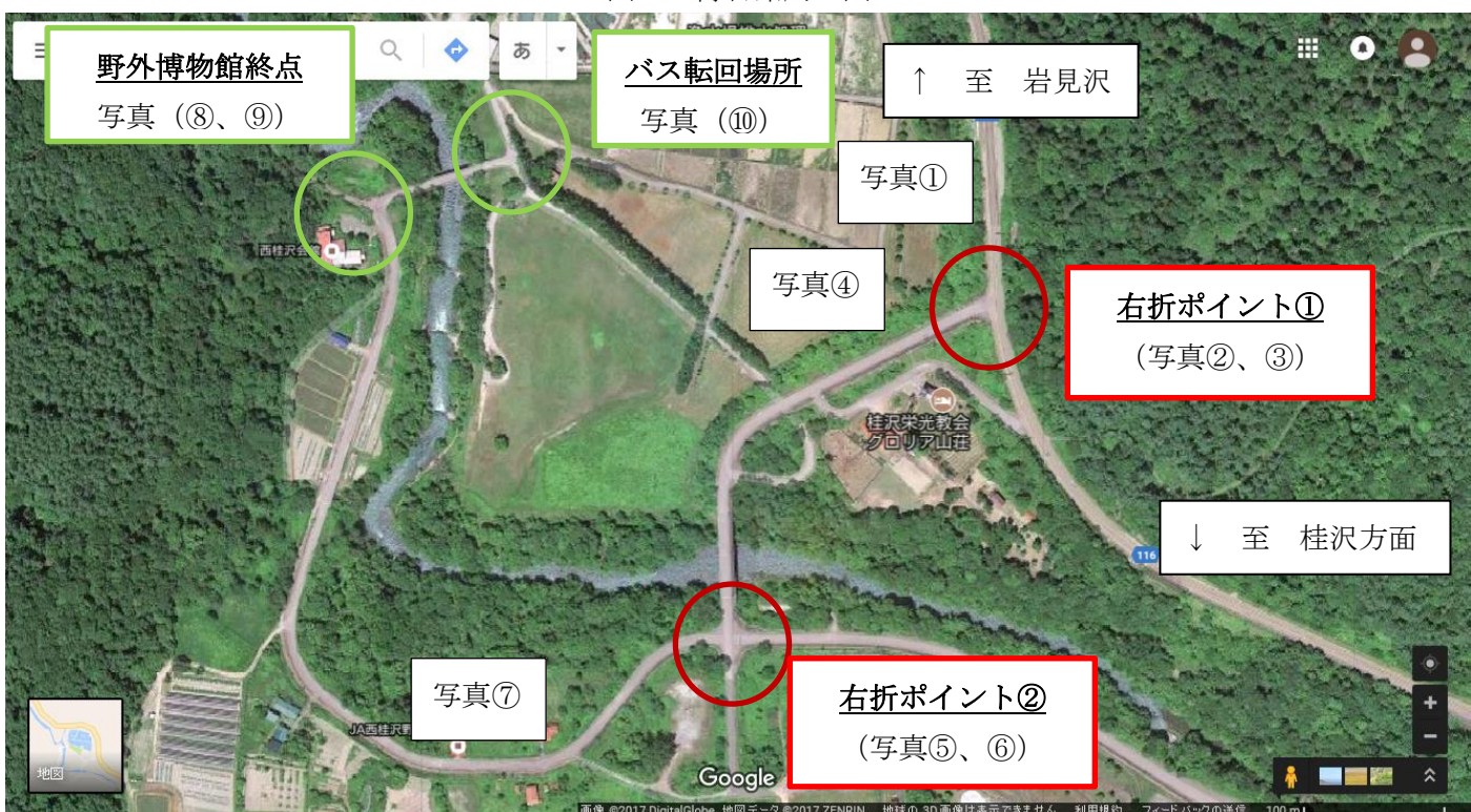
図2 野外博物館終点拡大図