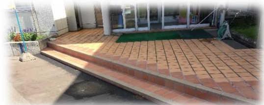
【きれいになった玄関】