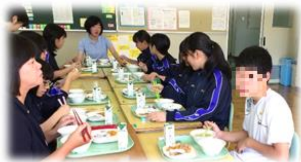
おいしい給食と一緒に！好き嫌い無し！

はじめまして！シンガポールから来ました です。趣味は読書、バドミントン、美味しいものを食べることです(納豆だけは…)。これから、みなさんと英語を勉強できることを楽しみにしています。よろしくお願ひします！