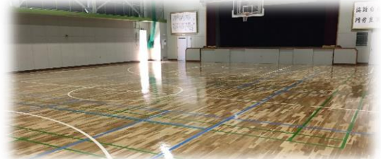
【屋根と床を直していただきました】

保護者の皆様には、2学期の学校行事やPTA活動など、様々な形で本校教育活動についてご理解・ご協力をいただくこととなります。どうぞよろしくお願いいたします。また、地域の皆さまには、お忙しい中、本校の「総合的な学習の時間」等でキャリア教育や体験活動を快くお引き受けいただき、心より感謝申し上げます。