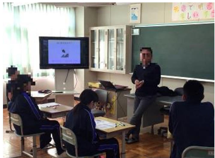
【作成したエゴグラムを使って自分の特徴を知る】