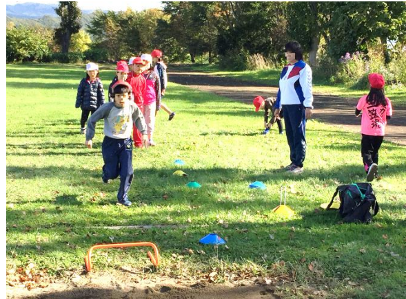
【ミニハードルを置くと…！！】