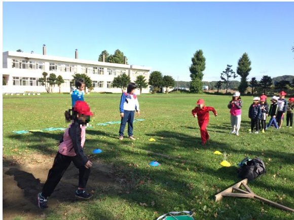
【まずは助走のスピード！】

こういった子どもの「できた！」「わかった！」をもっと増やしていきたいと思います。