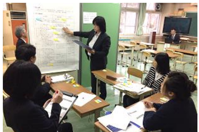
拡大指導案を使って授業後の研究協議