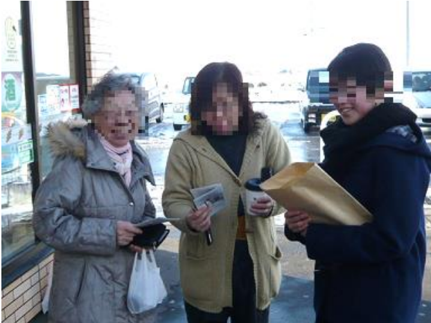
パンフレットを配りながら三笠をPR（道の駅）

作成したパンフレットをJR岩見沢駅、岩見沢駅バスターミナル、イオン三笠店、道の駅三笠で配布。恥ずかしくてモジモジしている生徒もいましたが、積極的に笑顔で声をかけ、パンフレットを基にしっかりPRできました。