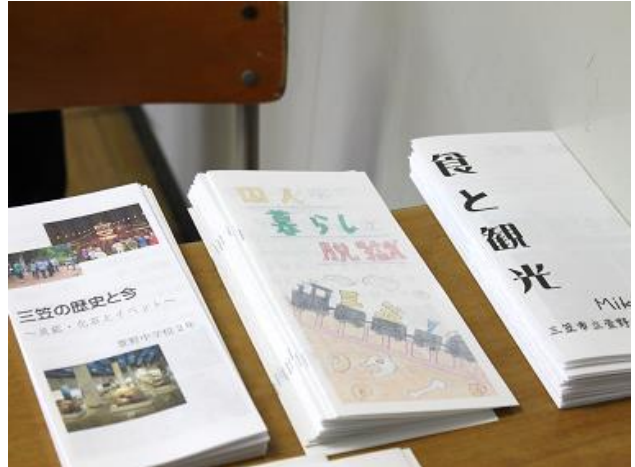
これまでの学習成果を基にした自作のパンフレット