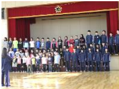
【音楽の合同授業(小・中)】