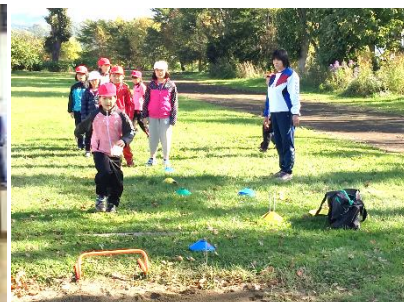
【体育の交換授業(小3・4)】