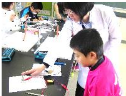
【理科の交換授業(小5)】

その他、数学や体育でも実施しています。こうした教科の専門性を活かした授業を展開できたり、小学校で学んだ知識や技術を中学校で「活用」したり、他者に分かるように「伝える」ことで、さらに学びが深まります。こうした活動を小中連携の下でできるのも「小中一貫」の強み・利点です。