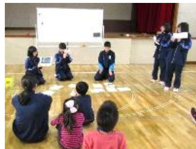
【国際科の合同授業(中2&小3・4)】