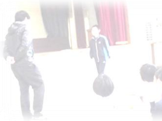
不審者にあつた時の模擬訓練