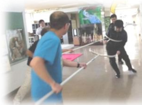
職員で不審者に対応しました。

その後の集会では、学校外で不審者に遭遇した時の対応の仕方(合い言葉は「いかのおすし」)を確認し、模擬訓練を行いました。