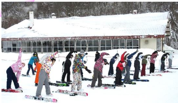
まずは準備体操! 体が...