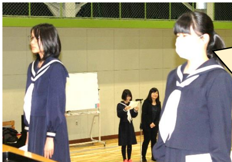
始業式前に行われた伝達表彰式

毎日新聞社主催 第46回中学生作文コンクール ＜奨励賞＞ 3年生 さん 1年生 さん