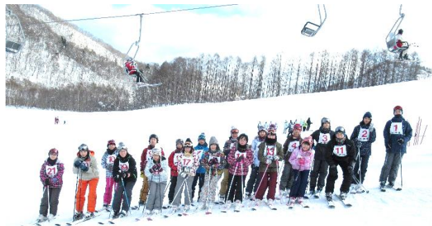
最後にハイポーズ!

1月25日(金)桂沢国設スキー場で「スキー教室」が行われました。冬季のスポーツに親しみ、体力の維持・向上を図ること、グレンデスキーのマナーを身につける事などを目的として実施しました。