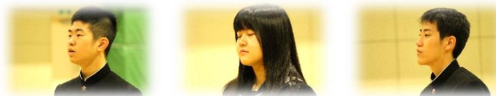
【中学校生活最後の学活】