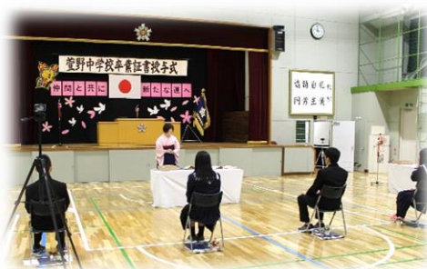
【校長先生からの記念品】