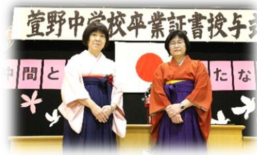
【公務士さん手作り】