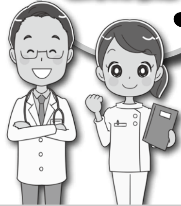
市立病院で働く医師を紹介します