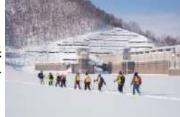
冬のジオツアーの様子

雪を踏みしめながらスノーシューを楽しんだり、パフェを作りながら雪の恵みを体験したり、たくさんの方々に、三笠の素晴らしい雪を楽しんでいただきました。今年は少し春が早く来てしまいましたが、来年も、雪を楽しむ冬ツアーやイベントを実施しますので、楽しみにお待ちください！