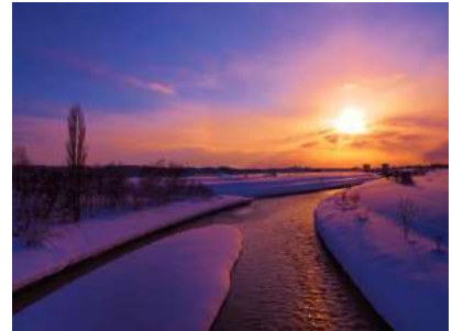
【一般投票賞】 幾春別川―冬の暮色

2月1日から2月28日まで行われた一般投票と北海道写真協会三笠支部による審査が終了し、三笠ジオパーク写真コンテスト2022入賞作品が決定しました。特選・入賞・GP賞・特別賞と皆様が選んだ一般投票賞の入賞作品につきましては、HPに掲載しているほか、イオンスーパーセンター三笠店内Mikasa City Informationで展示していますので、ぜひお立ち寄りください。