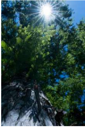
【特選】 太古から見守り