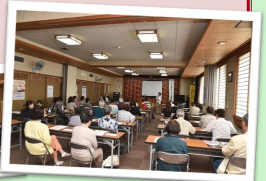
～令和元年度の開催様子～