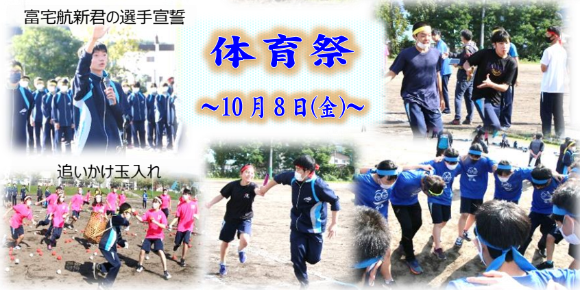
追いかけて玉入れ