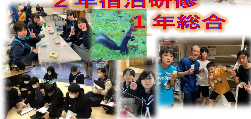
旭川ジオパークへ