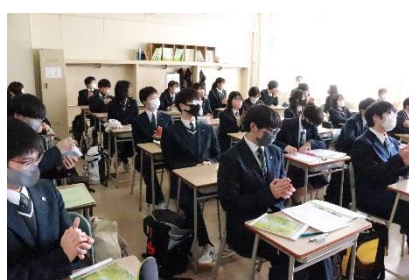
2年生は、「視聴覚教室」から「2階2学年HR教室」へ。給食は「2階白習室・講義室」で摂ります。