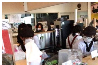
エソールストアにお立ち寄りいただき特産品等を購入いただきました〔地域連携部〕