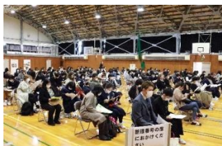
午前午後分けて体育館での全体説明

10月16日(土)、新型コロナウイルス感染拡大防止に係わる国の緊急事態宣言により、一ヶ月延期して開催しました。今年度は、生徒1名と保護者または教員1名に参加を限定したことから、リモートでの配信も行いました。全道各地より192名の参加、5名のリモート希望がありました。また、日程変更により参加できない生徒に配慮し、個別の対応を行いました。