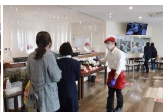
注文いただいた焼き菓子セットを引き換えるシェリー内〔製菓部〕