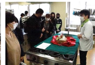
調理実習室に用意した料理、調理器具、実習内容等を見学いただき説明に当たりました