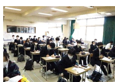
3年生は、「4階多目的教室」から「2階視聴覚教室」へ。給食も「2階視聴覚教室」で摂ります。