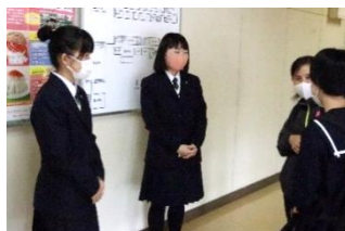
参加された中学生や保護者に丁寧に説明し対応していました