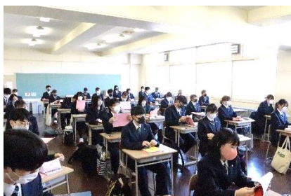
1年生は、「給食室」から「4階多目的教室」へ。給食は「給食室」で摂ります。

今年度当初より、新型コロナウイルス感染拡大防止の対応を学校全体で行ってまいりました。先月末、北海道では、これまでの感染防止対策を緩和する措置が執られました。これにより、本校でもHR教室を変更しました。