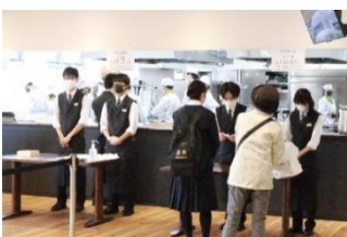
注文いただいたまごころきっちゃんのお弁当引き渡し〔調理部〕