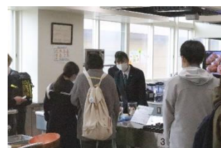
製菓実習室に用意した作品、用具、レシピノート等を見学いただき説明に当たりました