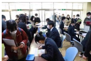
4グループを2回に分けた受付