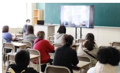
リモートを利用し、保護者の皆様に授業を参観していただきました。