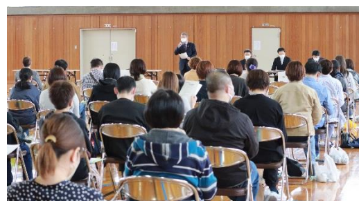
体育館で行われましたPTA総会の様子

新型コロナウイルス感染症の影響から、さまざまな制限や延期・中止が続き、ここ2年は本校のPTA活動も大きく様変わりしています。今年度のPTA活動についても、保護者の皆様のご協力やご理解をいただきながら、より充実した活動につながるよう進めていきたいと考えています。どうぞよろしくお願いいたします。