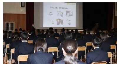
説明を聞く生徒達

スマホ利用の際には、ルールの決めることや送信前に確認することなど、当たり前のことを確実にを行うことの大切さを再確認できました。