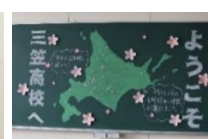
↑ 11期生担任の 小笠原先生による 黑板アート