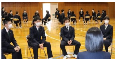
交流会をグループごとで楽しみました