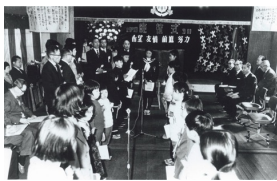
思い出コレクション「歴史写真部門」のイメージ ※写真は奔別小学校廃校式

「劇場前で撮った記念写真」など、何気ないけどどこか懐かしい、そんな写真を集めて、皆さんと共有したいと考えています。そして、応募期間終了後には、現在を写す「写真コンテスト」と「思い出コレクション」から各々一般投票を行ない、未来へと残したい作品を皆さんと一緒に選んでいこうという特別企画です。皆さん、奮ってご参加ください。