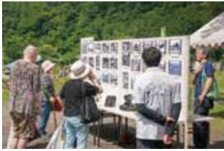
みかさ思い出写真館 in 弥生墓地

十五日に「みかさ 思い出写真館」を 生墓地」を行ない ます。昔の写真を 見て昔のまじの様 子をイメージでき る展示になってい ます。