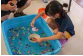
お盆イベントの様子