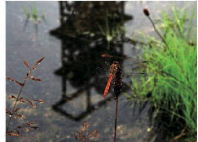
写真コンテスト 2023 特選

三笠ジオパーク写真コンテスト二〇二四の開催が決定しました。今年度は「ジオの恵み部門」と「ジオの景色・魅力部門」の二部門で作品を募集します。 「ジオの恵み部門」では、三笠市の基幹産業である「農業」をテーマに部門を設けました。農作物や収穫風景（田園、ぶどう畑等）などに特化した部門です。 「ジオの景色・魅力部門」では、農業以外の「地域の魅力が伝わるものや景観」を大募集します。 応募期間は、九月一日（日）から翌年二月十日（月）までです。みなさんのご応募をお待ちしています。