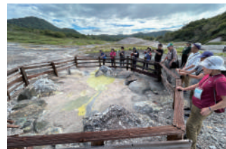
ポストツアーの様子

八月三十日(金)〜九月二日(月)に、第十四回日本ジオパーク全国大会下北大会が、青森県の下北半島、むつ市を会場に開催されました。台風の心配はありましたが、大会は無事に開催されました。今年度は、「ジオパークでつながる海大地未来」をテーマに、ジオパークの海や大地を通して全国、さらに世界へと輪を広げ、この活動や理念を次の未来へつなげていくことを目的としています。国内のジオパークが一堂に集まり、アイデアを交換し、さまざまなトピックやテーマについて話し合うことのできる場が全国大会です。 プログラムとしては、パネルディスカッション、ポスター発表、分科会、口頭発表がありました。特に今回のテーマである「未来」を考えるにあたり、下北の子どもたちによる多くの発表がありました。 大会後には、ポストツアーに参加して、現地のジオガイドにお世話になりました。大変勉強になりました。