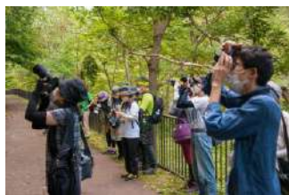
ジオツアーの様子

七月二十九日(土)「ぶどう畑とワイナリー見学ツアー」の順で開催されます。詳しくはチラシをご覧ください。また、八月以降のジオツアーは近々お知らせします。