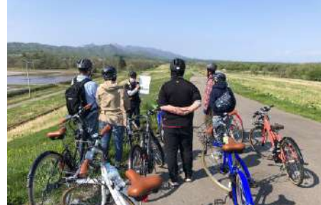
ジオツアーの様子