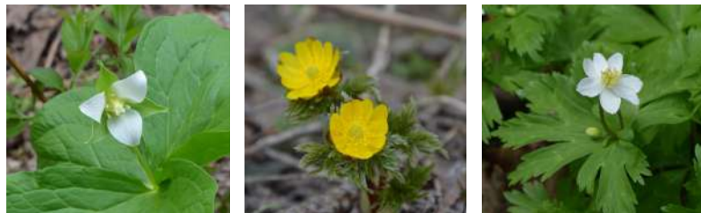
ミヤマエンレイソウ