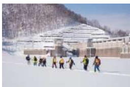
冬のジオツアーの様子

雪を踏みしめながらスノーシューを楽しんだり、パフェを作りながら雪の恵みを体験したり、たくさんの方々に、三笠の素晴らしい雪を楽しんでいただきました。今年は少し春が早く来てしまいましたが、来年も、雪を楽しむ冬ツアーやイベントを実施しますので、楽しみにお待ちください！