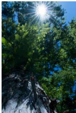
【特選】 太古から見守り