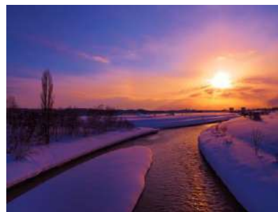
【一般投票賞】 幾春別川―冬の暮色

2月1日から2月28日まで行われた一般投票と北海道写真協会三笠支部による審査が終了し、三笠ジオパーク写真コンテスト2022入賞作品が決定しました。特選・入賞・GP賞・特別賞と皆様が選んだ一般投票賞の入賞作品につきましては、HPに掲載しているほか、イオンスーパーセンター三笠店内Mikasa City Informationで展示していますので、ぜひお立ち寄りください。