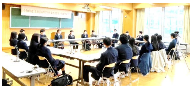
全道から14名の発表者が集まりました。意見交流会では小樽水産高校の生徒会が司会を務めました。↑