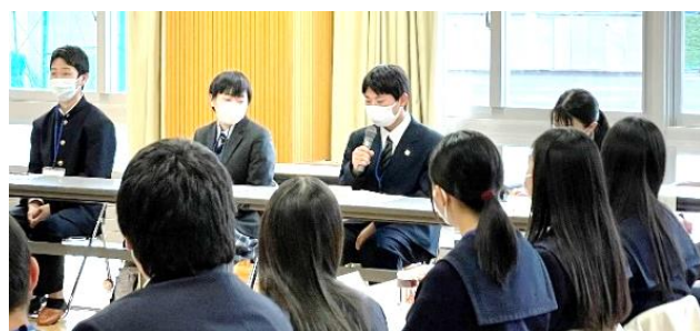
意見交流会で三笠高校の概要を説明しました。↓