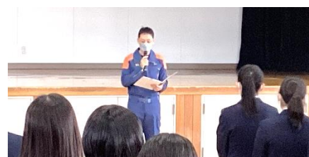
消防本部の職員の方からお話いただきました。お忙しい中、ありがとうございました。↑

200kgにも耐えうる段ボールベッドの寝心地を確かめながら、災害にあっても的確な判断と行動が取れるよう、気持ちを引き締めようと思える訓練となりました。