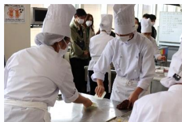
1年製菓コース：実習の様子