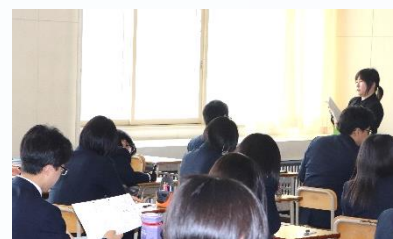
2年：数学の授業の様子