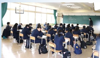
3年：英語の授業の様子