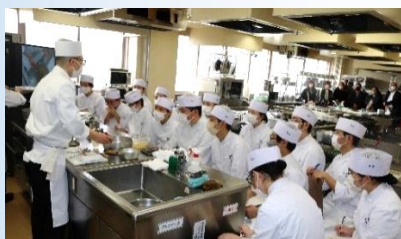
1年調理師コース：実習の様子

これからも保護者の皆様からのご協力をいただきながら、生徒の成長を促していきたいと思ひますので、どうぞ今後ともよろしくお願ひします。