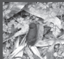
アライグマのフン