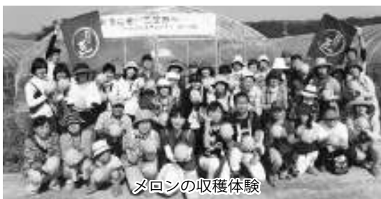
メロンの収穫体験

二日目は山崎ワイナリーの見学や、三笠ジオパークジオツアーに参加するなど三笠の味と風土を体感しました。