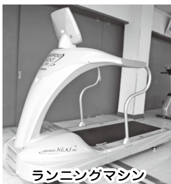
ランニングマシン