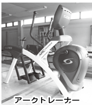
アークトレーナー