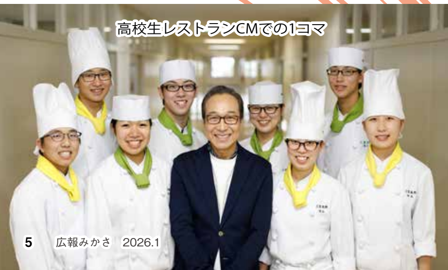
高校生レストランCMでの1コマ