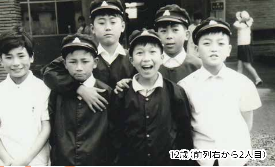
12歳(前列右から2人目)