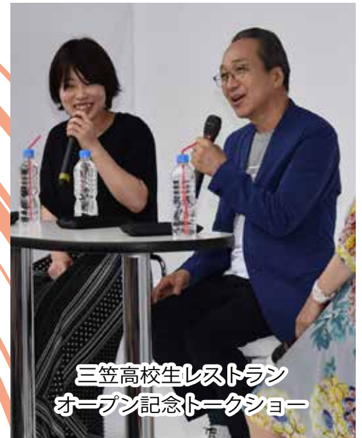
三笠高校生レストラン オープン記念トークショー