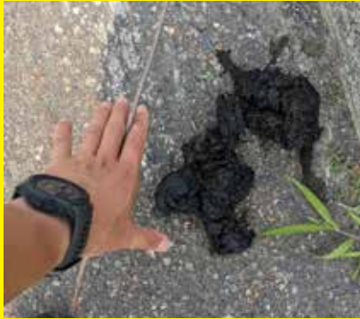
ヒグマの糞・足跡の写真(市内で撮影)

また、ヒグマを発見した時の通報は、場所、時間、大きさ、立ち去った方向を詳しく教えてください。